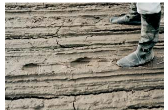
写真1 適度の田干し状況